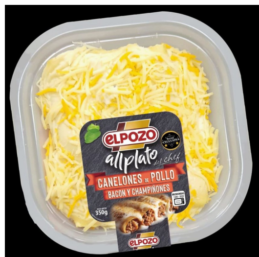
CANELONES POLLO, BACON Y CHAMPIÑONES. Caja: 4 uds