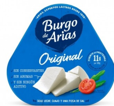
BURGO DE ARIAS 216gx12 uds