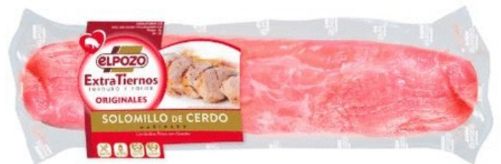
SOLOMILLO EXTRATIerno VACÍO