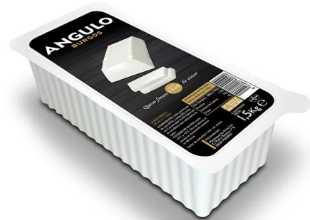
BURGOS BARRA 1,5 KG NATURAL O BAJO EN SAL. Caja: 2 UDS