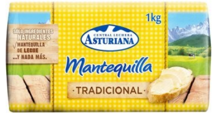
MANTEQUILLA KILO. Caja: 6 uds