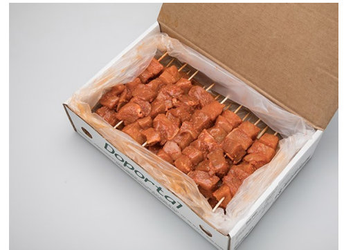
PINCHO MORUNO DOPORTAL