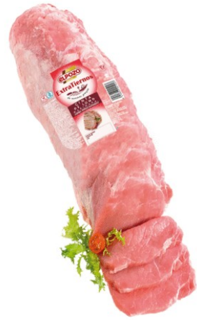
LOMO EXTRATIerno VACÍO 4KG APROX