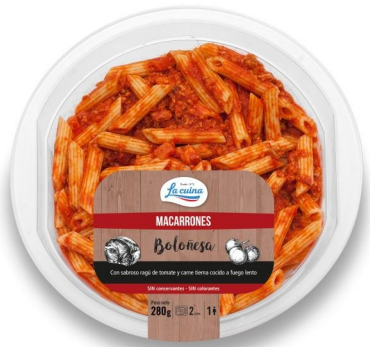
MACARRONES BOLOÑESA 280G. Caja: 6 uds