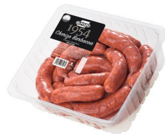
CHORIZO BARBACOA 1954 2kg aprox