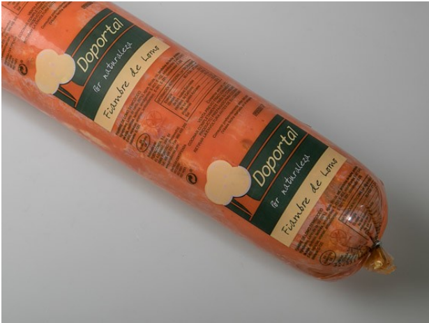
LOMO ADOBADO 1/2