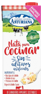
NATA COCINAR LITRO. Caja: 6 uds