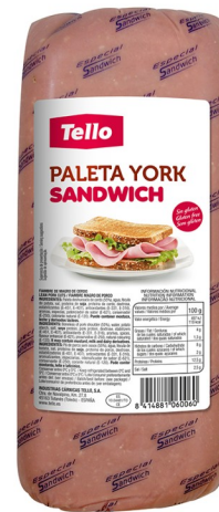
PALETA YORK SANDWICH. Caja: 2 uds