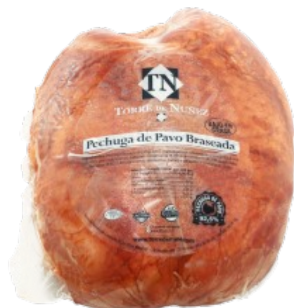
PECHUGA PAVO BRASEADA