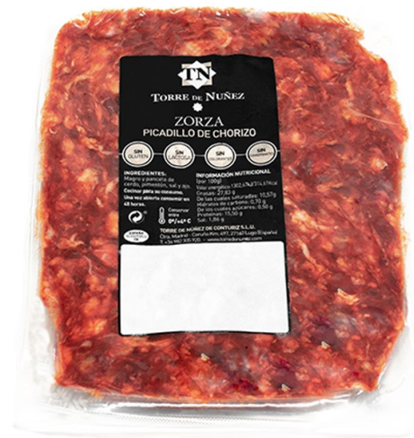
ZORZA TORRE DE NUÑEZ. Caja: 16 uds