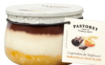
CAPRICO NARANJA Y CHOCOLATE 150g. Caja: 6 uds