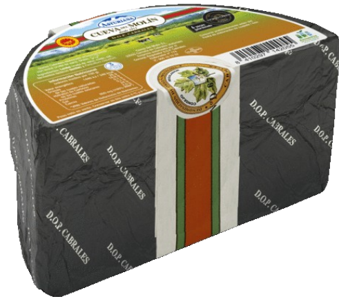
CABRALES D.O. 1/2 PZ