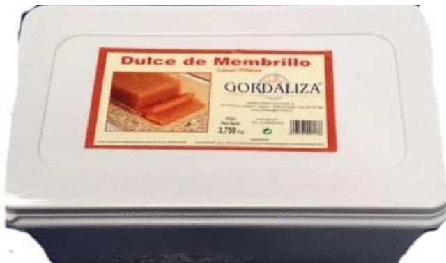
DULCE DE MEMBRILLO 3,75 KG. Caja: 2 uds