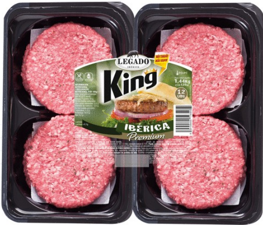
BURGER IBÉRICA KING 12 UDSx 120g