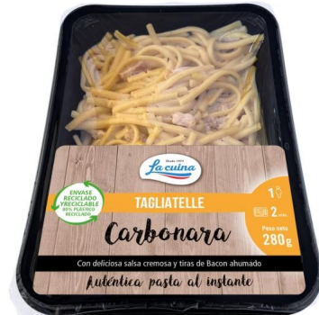
TAGLIATELLE CARBONARA 280G. Caja: 6 uds