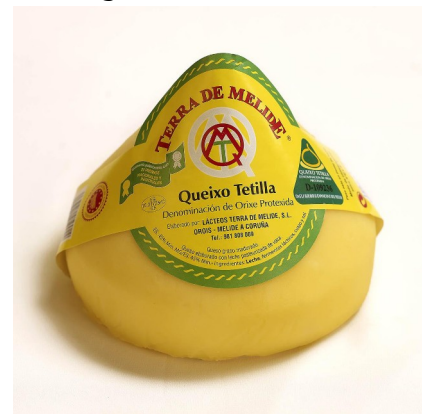
QUESO TETILLA D.O.P.. 850 grs aprox.