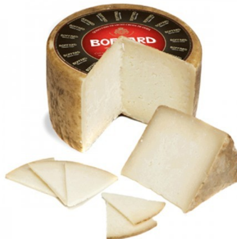
BOFFARD RESERVA. Caja: 2 uds