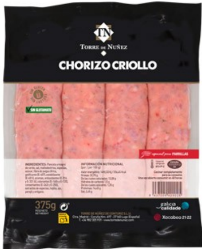
CHORIZO CRIOLLO TORRE DE NUÑEZ 300 GRS. Caja: 16 uds