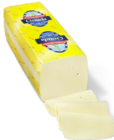
BARRA GOUDA 3k. Caja: 4 uds