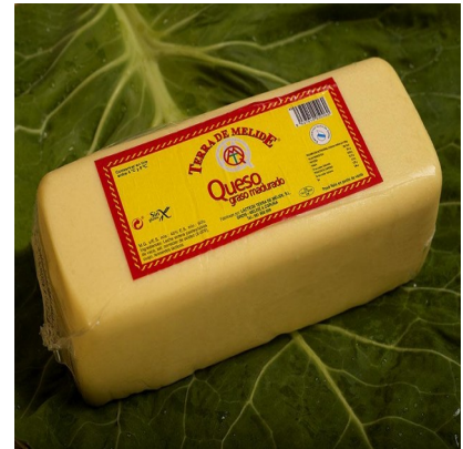
QUESO BARRA TERRA DE MELIDE