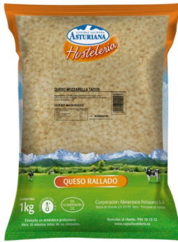
MOZZARELLA TACOS 1kg. Caja: 6 uds