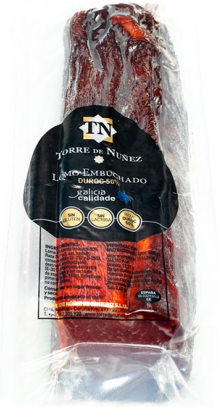
LOMO EMBUCHADO 1/2