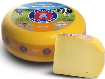
GOUDA TIERNO 4,4 KG. Caja: 2 uds