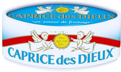
CAPRICE DES DIEUX 125G. Caja: 8 uds