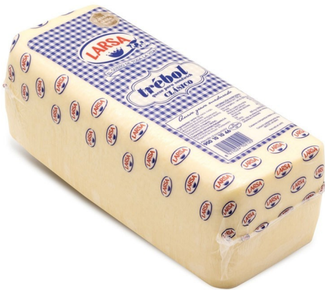
BARRA LARSA. Caja: 3 uds