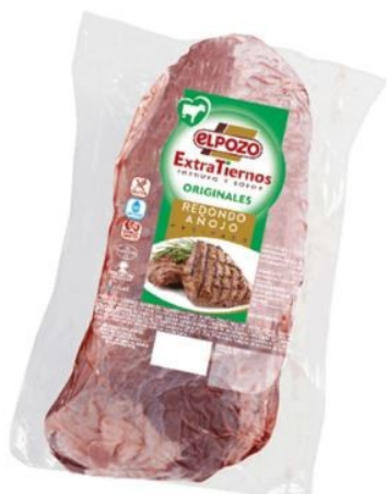
REDONDO AÑOJO VACÍO EXTRATIerno