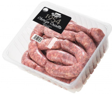
CHORIZO CRIOLLO 1954 2 kg aprox