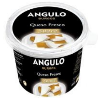
TARRINA ANGULO 500 GRS. Caja: 6 UDS