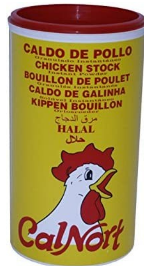
CALDO POLLO 1K