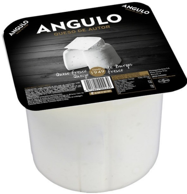
ANGULO BURGOS UF 2KGS. Caja: 2 UDS