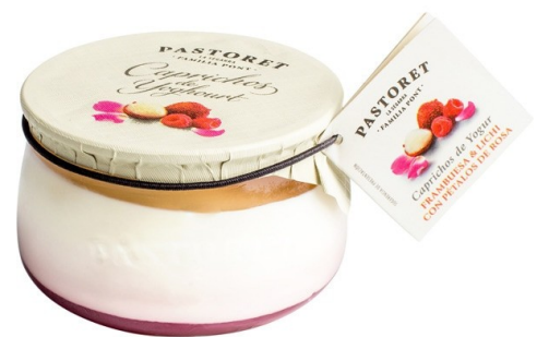
CAPRICO FRAMBUESA Y LICHI 150g. Caja: 6 uds