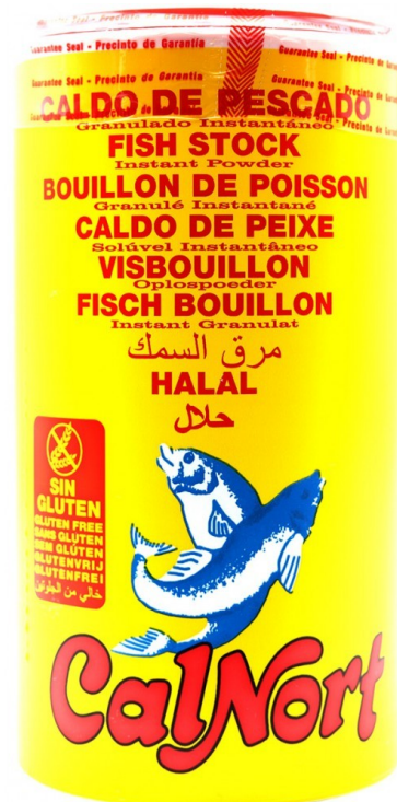
CALDO PESCADO 1K