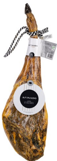
JAMÓN RAZA IBÉRICA 50%