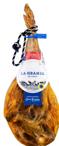
JAMÓN DUROC RESERVA 18M