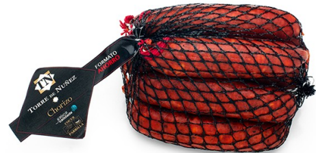
CHORIZO MALLA 500G. Caja: 12 uds