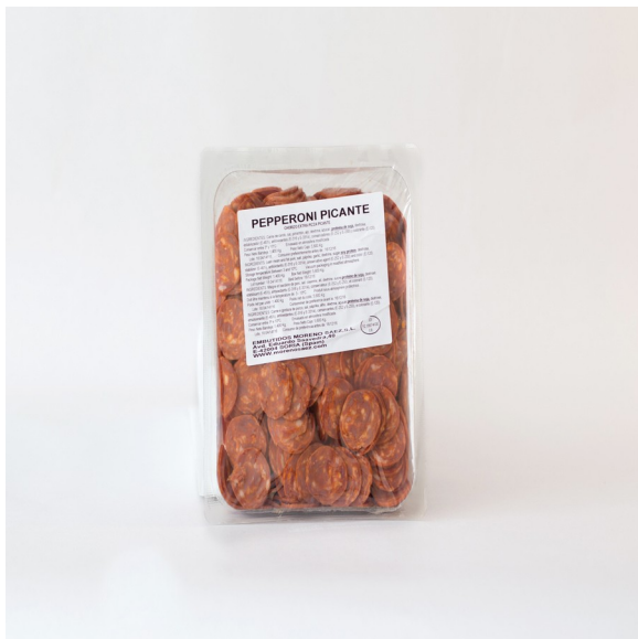
PEPPERONI LONCHEADO 1.4k. Caja: 4 uds