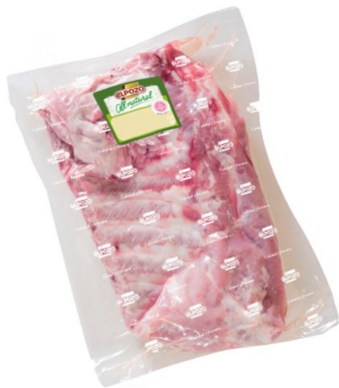
COSTILLA CERDO VACÍO