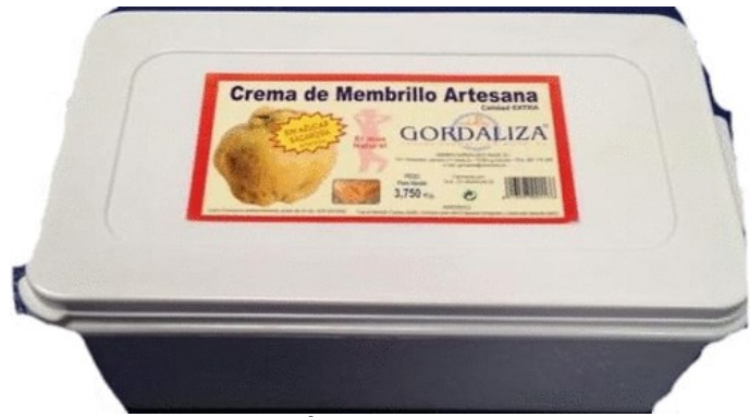
MEMBRILLO DIETÉTICO 3,75 KG. Caja: 2 uds