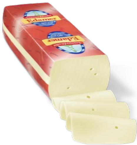
BARRA EDAM 3k. Caja: 4 uds