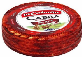
LA CABAÑA CABRA PIMENTÓN 2.2 KG