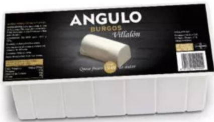
VILLALÓN TRADICIONAL ANGULO 2KGS. Caja: 2 UD