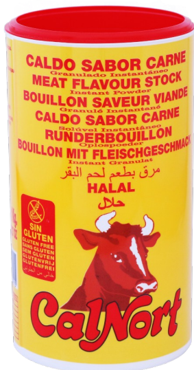
CALDO CARNE 1K