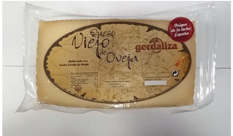
PURO OVEJA GORDALIZA ½. Caja: 4 uds