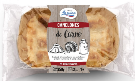
CANELONES CARNE 350 G. Caja: 6 uds