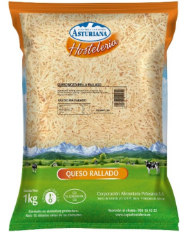
MOZZARELLA RALLADA 1kg. Caja: 10 uds