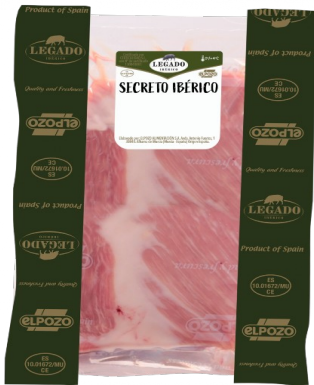
SECRETO IBÉRICO CERDO VACÍO