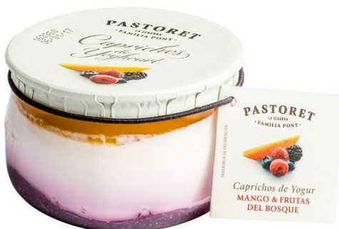
CAPRICO MANGO Y FRUTAS DEL BOSQUE 150g. Caja: 6 uds