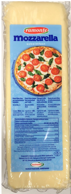
MOZZARELLA BARRA 2,3KG. Caja: 4 uds