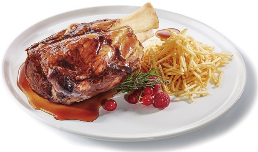
CODILLO ASADO EN SU JUGO. Caja: 12 uds.