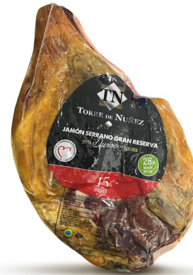
CENTRO JAMÓN CORTE V 15 MESES. Caja: 2u