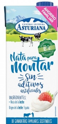
NATA MONTAR LITRO. Caja: 6 uds