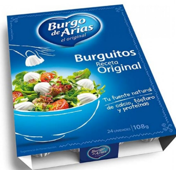
BURGUITOS 108 GRS. Caja: 10 uds.