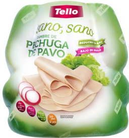
PECHUGA PAVO SANO SANO