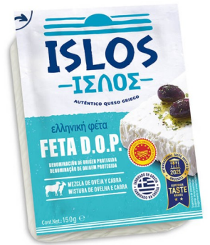
QUESO FETTA ISLOS. Caja: 12 uds