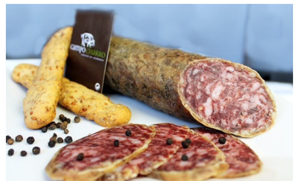
SALCHICHÓN BELLOTA 1/2 PZAS