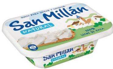
SAN MILLÁN 150 GRS. Caja: 8 uds