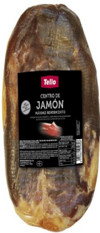
CENTRO JAMÓN ALTO RENDIMIENTO. Caja: 2u