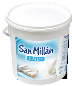
SAN MILLÁN 3KG. Caja: 2 uds