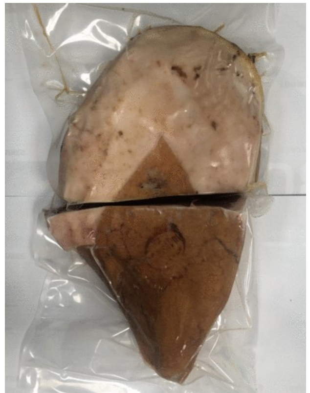
JAMÓN SERRANO 1/2 DESHUESADO. Caja: 4 uds.