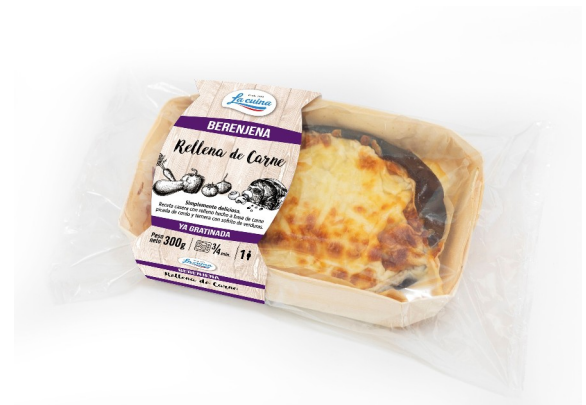
BERENJENA RELLENA 300G. Caja: 6 ufs