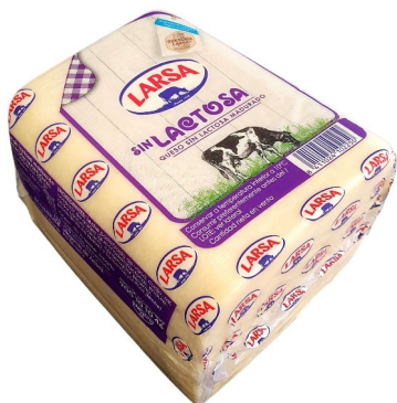
BARRA LARSA SIN LACTOSA. Caja: 2 uds