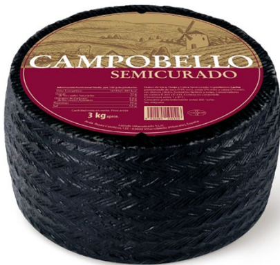
CAMOBELLO SEMI. Caja: 2 uds