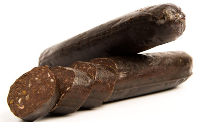
MORCILLA DE BURGOS. Caja: 12 uds