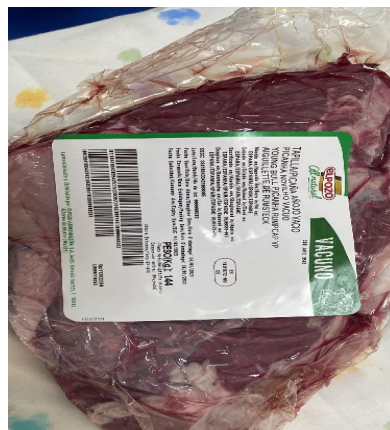
PICAÑA AÑOJO VACÍO