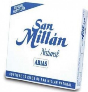
SAN MILLÁN 10 KG