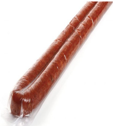
CHISTORRA NAVARRA 220G. Caja: 16 uds