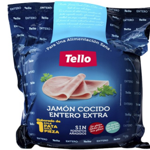
JAMÓN COCIDO ENTERO TELLO