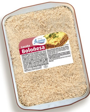
LASAÑA BOLOÑESA 3K