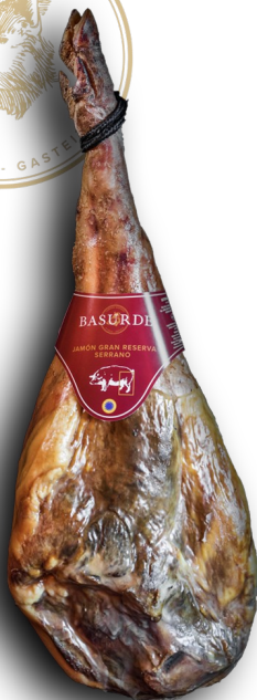
JAMÓN GRAN RESERVA DUROC +24MESES