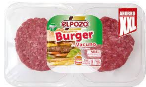
BURGER VACUNO 90 GRS X 8