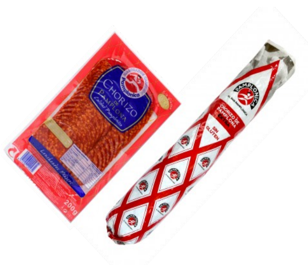
CHORIZO PAMPLONA PAMPLONICA