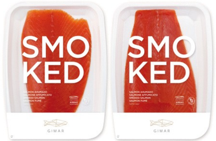
SALMÓN AHUMADO PRECORTADO. Peso caja: 1,3 kg 1prox