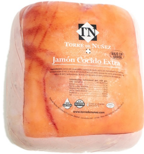
JAMÓN COCIDO TORRE DE NUÑEZ