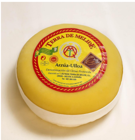
QUESO ARZÚA-ULLOA D.O.P. (850, 1,3 Y 3,5 KG)