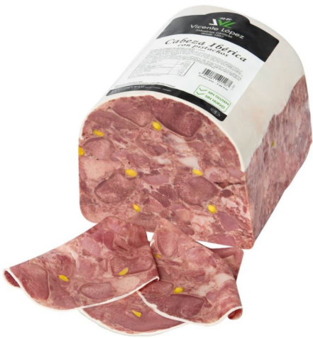
CABEZA JABALÍ IBÉRICA CON PISTACHOS