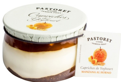
CAPRICO MANZANA AL HORNO 150g. Caja: 6 uds