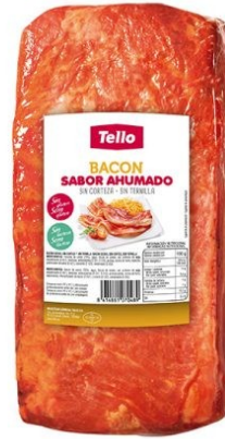
BACON AHUMADO SIN CORTEZA SIN TERNILLA. Caja: 2 uds