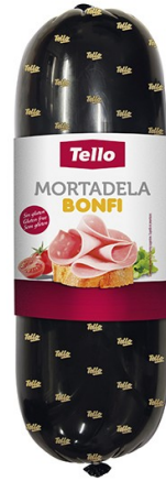
MORTADELA TELLO. Caja: 2 uds