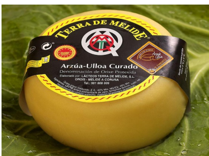
ARZÚA-ULLOA CURADO 700