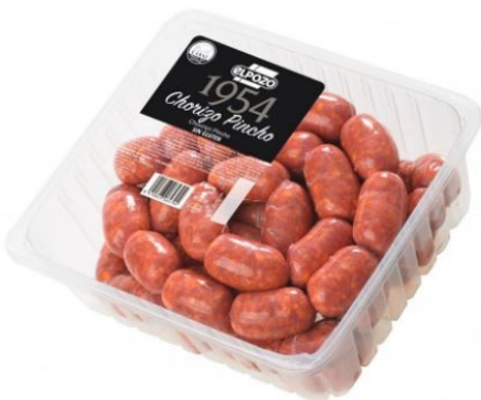
CHORIZO PINCHO 1954 2kg aprox