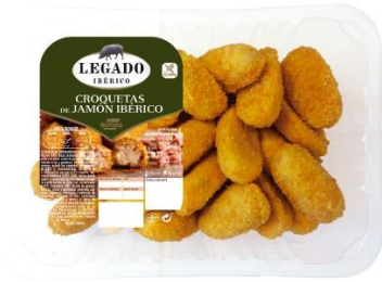
CROQUETAS JAMÓN IBÉRICO 1,1KG