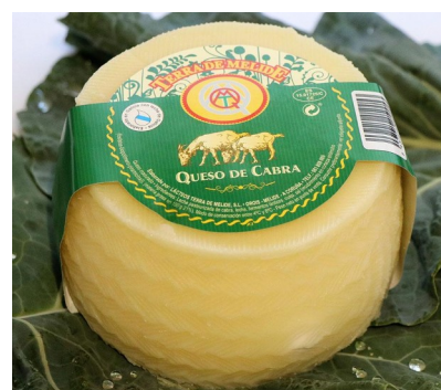
QUESO CABRA 1K