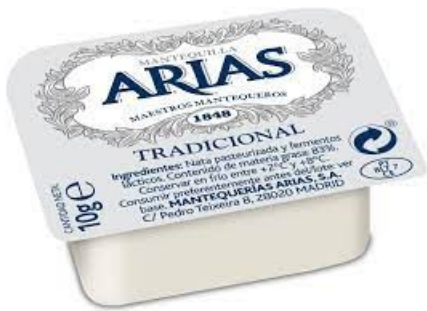
MANTEQUILLA MICRO 10GX100 uds