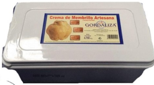
CREMA MEMBRILLO 3,75KG. Caja: 2 uds