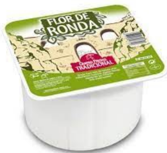
QUESO FRESCO CABRA FDR 1,7 KG. Caja: 2 UDS