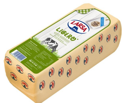
BARRA LARSA LIGERA. Caja: 3 uds