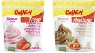
POSTRES DESHIDRATADOS SABORES