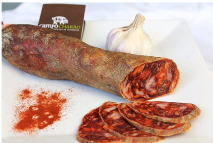
CHORIZO BELLOTA 1/2 PZAS