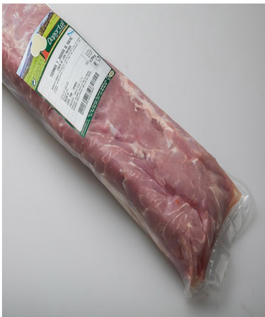
LOMO EXTRATIerno DOPORTAL