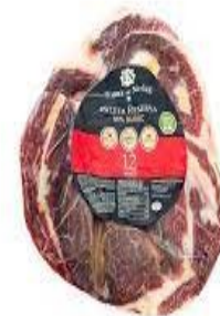
PALETA DUROC DESH. TORRE DE NUÑEZ. Caja: 12 uds