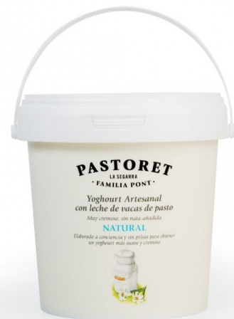
YOGUR 3,6K PASTORET