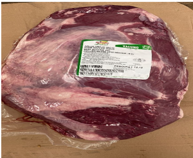
AGUJA AÑOJO VACÍO