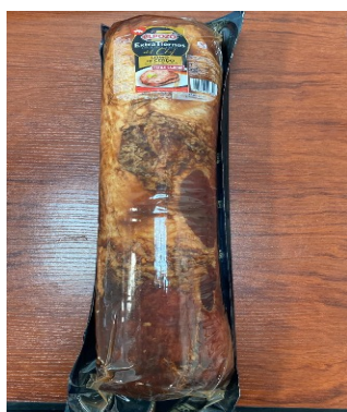
LOMO SAJONIA EXTRATIerno