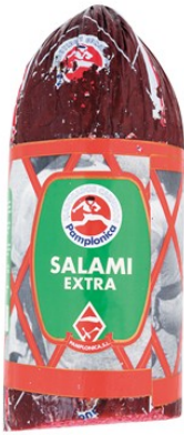
SALAMI 1/2 PAMPLONICA. Caja: 2 uds